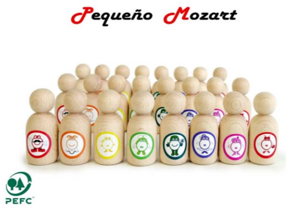
Peg Dolls "Pequeño Mozart" con notas musicales - 24 unidades