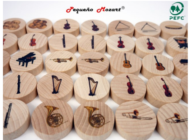
Instrumentos musicales & Memory "Pequeño Mozart"