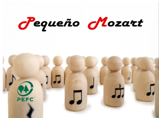
Peg Dolls "Pequeño Mozart" con figuras musicales – 50 unidades