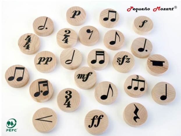
Figuras musicales "Pequeño Mozart" – Set 60 unidades