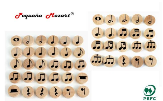
Figuras musicales "Pequeño Mozart" – Set 50 unidades