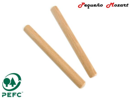
Claves en madera de haya "Pequeño Mozart"